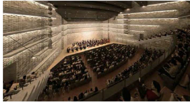
【大ホール完成イメージ】

大阪フィルハーモニー楽団と本市が連携協定を締結するなど運営面での準備も進めており、今年3月にはオープンに向けたプレイベントとして、同楽団のコンサートを開催しました。(コンサートは大阪歯科大学くずはキャンパスにて開催)